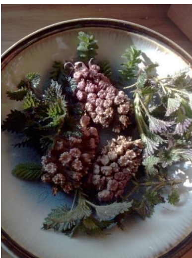
směs na čaj před zalitím

Ze spařené kopřivy si můžete uvařit jarní polévku, špenát nebo ji přidat do velikonoční nádivky. Jarní kůra pití kopřivového čaje je vynikající detoxikační prostředek.