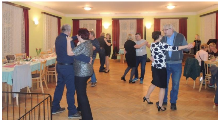
K tanci zahrálo duo z Holešova.