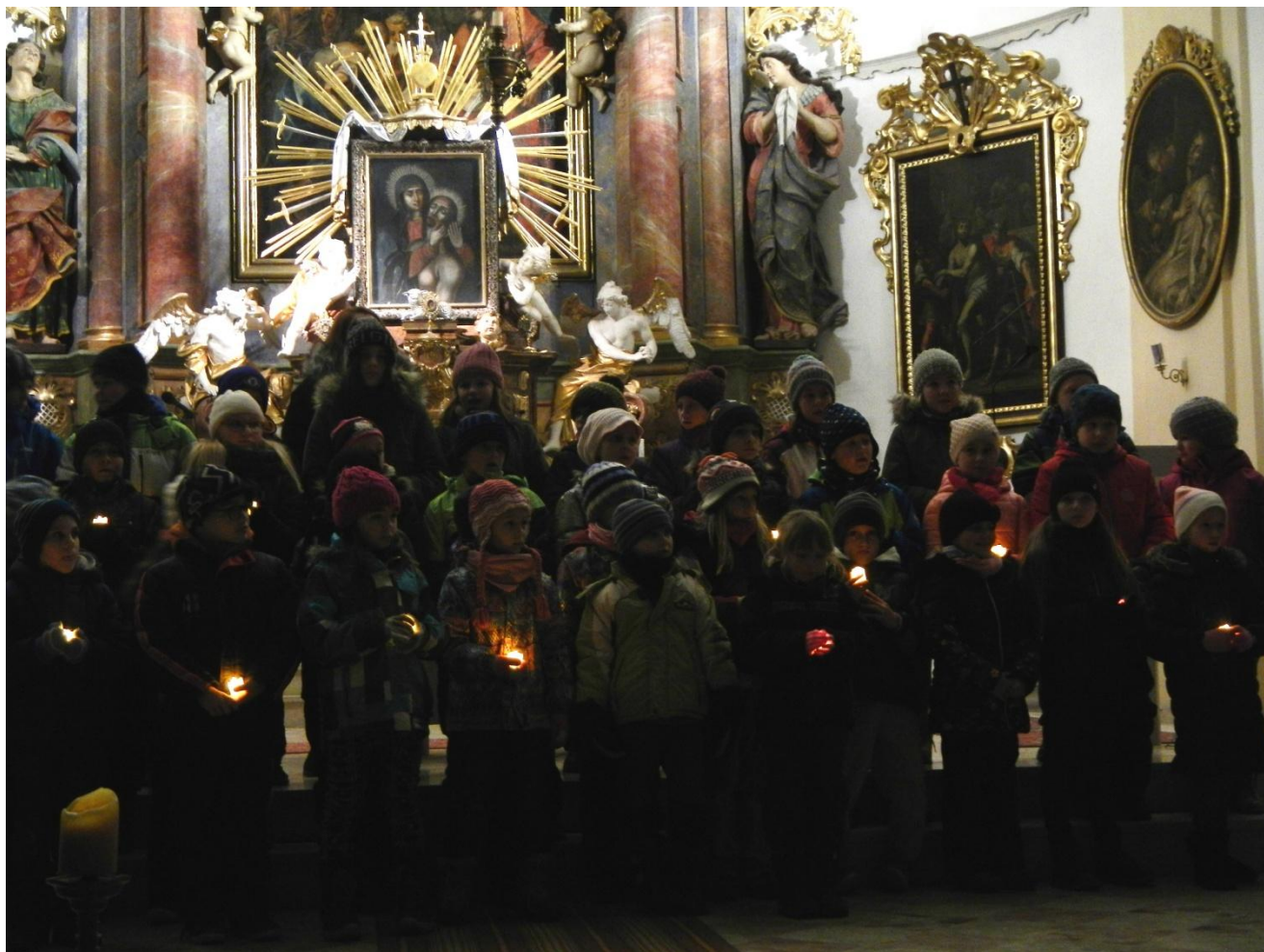
Fotografie z vystoupení žáků ZŠ Jívová na Adventním koncertu v kostele sv. Bartoloměje v Jívové 30. 11. 2018.